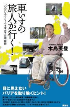
講談社「車いすの旅人が行く!」