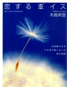
徳間書店「恋する車イス」