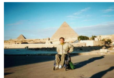
ピラミッド／エジプト