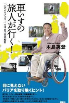
講談社「車いすの旅人が行く!」