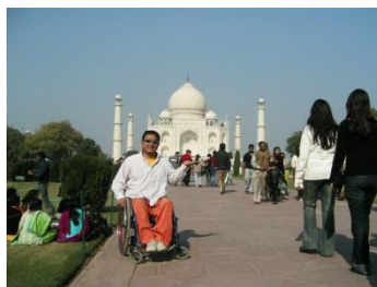
タージマハル／インド