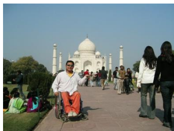
タージマハル／インド