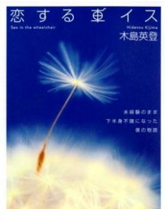
徳間書店「恋する車イス」