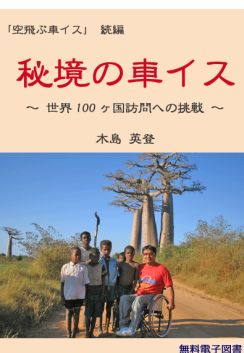
電子書籍「秘境の車イス」

1990年 大阪府立池田高校3年生、ラグビー部の練習中に下敷きとなり脊髄を損傷。車いすに。