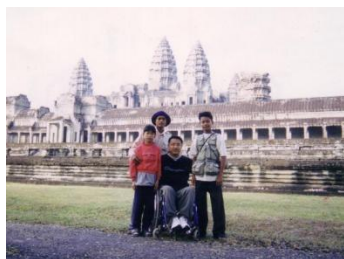
アンコールワット／カンボジア