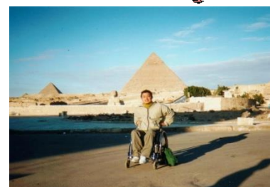
ピラミッド/エジプト