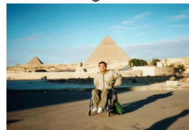
ピラミッド／エジプト