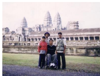
アンコールワット／カンボジア