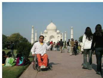
タージマハル／インド